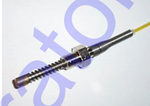
Thermocouples EGT et CHT type « K »